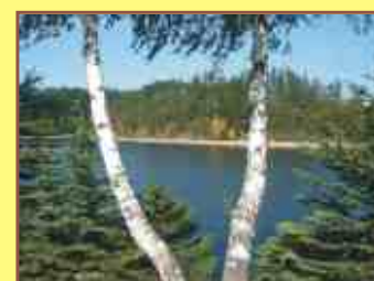
Trnávka - rekreační nádrž Bathing