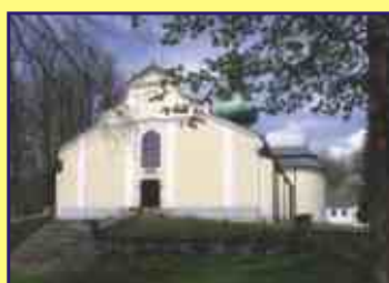
Křemešník - poutní místo, rozhledna The Place of pilgrimage